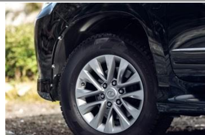
PASAJ ROȚI CU IZOLARE FONICĂ, KIT

Protecția metalică protejează în mod fiabil componentele mașinii de impact și contact cu diverse suprafețe sau neregularități ale traseului: pietre, gheață și altele.