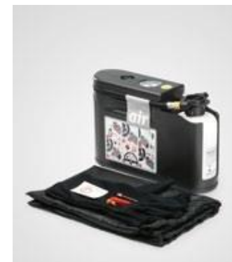
KIT REPARAȚIE ANVELOPE

Piulițele secrete pentru roți oferă o protecție garantată pentru jante. Este suficient să înlocuiești o singură piuliță obișnuită de la fiecare roată.