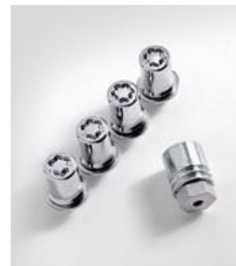
PIULIȚE SECRETE PENTRU ROȚI, KIT

Sistemul detectează o scădere a presiunii într-una sau în mai multe anvelope și avertizează șoferul prin intermediul unui indicator.