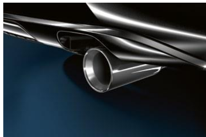
TOBA DE EȘAPAMENT CROMATĂ

Conturând perfect liniile caroseriei, deflectoarele deviază efectiv curenții de aer din sens opus, fapt ce oferă posibilitatea de a călători confortabil cu geamurile întredeschise și pătrunderea aerului proaspăt în cabina automobilului, inclusiv pe timp ploios.