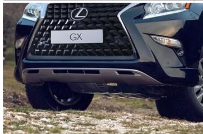
CARTERUL MOTORULUI ȘI CUTIA DE VITEZE

Protecția metalică protejează în mod fiabil componentele mașinii de impact și contact cu diverse suprafețe sau neregularități ale traseului: pietre, gheață și altele.