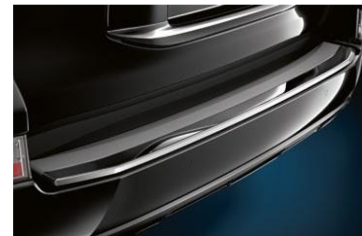
BANDĂ DE PROTECȚIE PENTRU BARA SPATE

Duză din oțel inoxidabil, cromată care adaugă eleganță și personalitate.