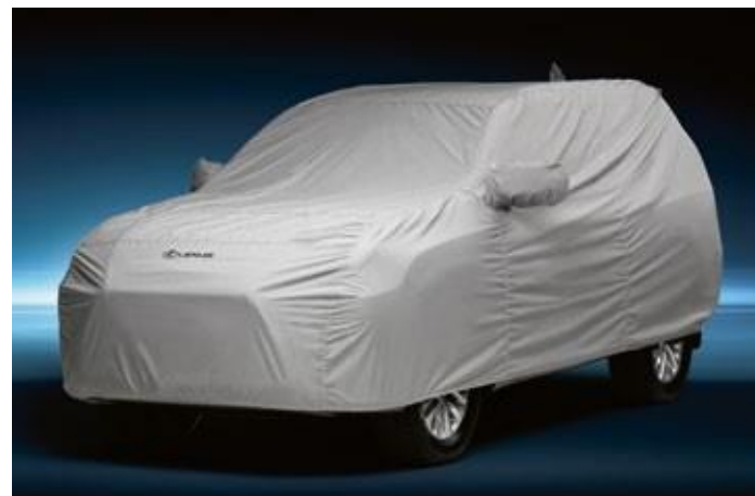
HUSĂ PENTRU AUTOMOBIL

Numerele pieselor pentru comandă trebuie verificate la dealerul autorizat Lexus.