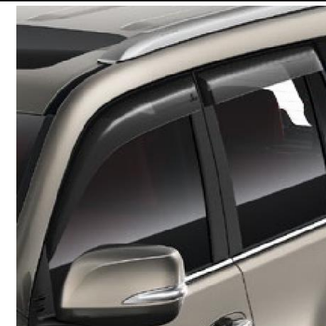
DEFLECTOARE GEAMURI LATERALE, KIT