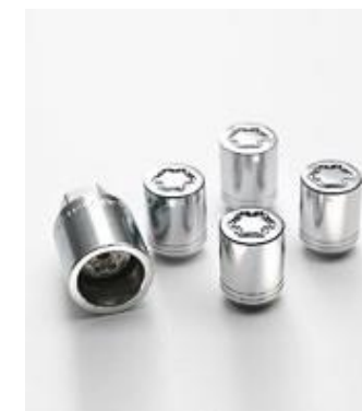
PIULIȚE SECRETE PENTRU ROȚI, SET

Dacă întâmpini probleme pe traseu, utilizează kit-ul de reparații Lexus pentru reparații rapide. Atenție: pentru o reparație completă, contactează cel mai apropiat dealer Lexus.