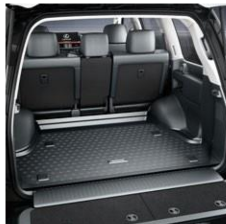
COVORAȘ ALL-SEASONS PENTRU PORTBAGAJ, CU BORDURĂ ÎNALTĂ

RW2TN6-0310-C0 – 5 locuri RW2TN6-0320-C0 – 7 locuri