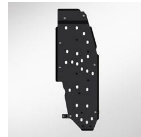
PROTECȚIE REZERVOR DE COMBUSTIBIL

Setul de apărători ale pasajului roților cu un strat suplimentar de material de izolare fonică permite minimizarea în habitacul a nivelului de zgomot care vine de la anvelope și de la nisipul și pietrele care zboară de sub roți.