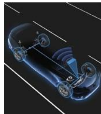
SENZORI DE MONITORIZARE A PRESIUNII ÎN ANVELOPE

Jante din aliaj cu design original, ușoare și rezistente, fabricate din aliaj de aluminiu de înaltă calitate.