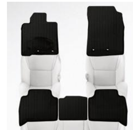
SET DE COVORAȘE DIN CAUCIUC PENTRU HABITACLU, CULOAREA NEAGRĂ

PZ49C-Q2353-DG – 5 locuri PZ49C-Q2354-DG – 7 locuri