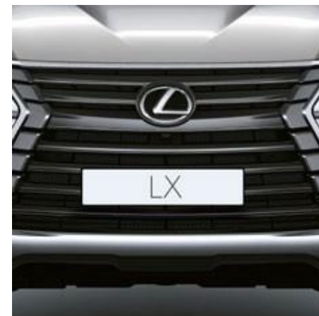
SET DE GRILE

Folia din material transparent și durabil va proteja suprafața de sub mâner de zgârieturi și deteriorări minore.