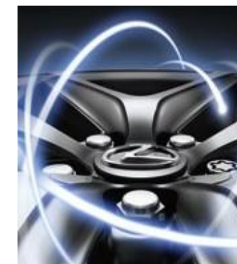
PROTECȚIE JANTE PROTECT

Piulițele secrete pentru roți reprezintă o protecție verificată pentru jante. Este suficient să înlocuiți o singură piuliță obișnuită de la fiecare roată pentru a proteja roțile împotriva furtului.