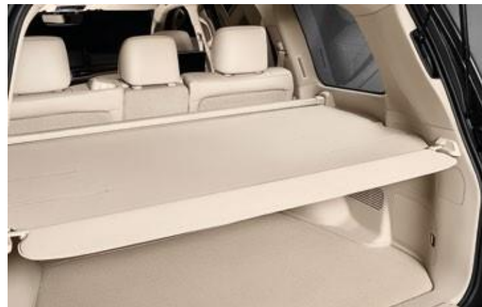
RULOU PENTRU PORTBAGAJ, BEJ