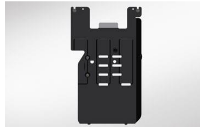
PROTECȚIE CUTIE DE VITEZE

PZ4AL-03003-00 – oțel PZ4AL-03004-00 – aluminiu