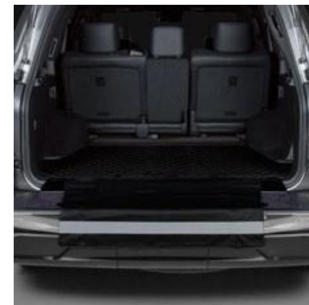
COVORAȘ DE PROTECȚIE PENTRU BARRA DE PROTECȚIE

PW241-60000 Covorașul protejează podeaua portbagajului de murdărie și scurgeri în timpul transportării lucrurilor și este ușor de curățat în caz de murdărie.