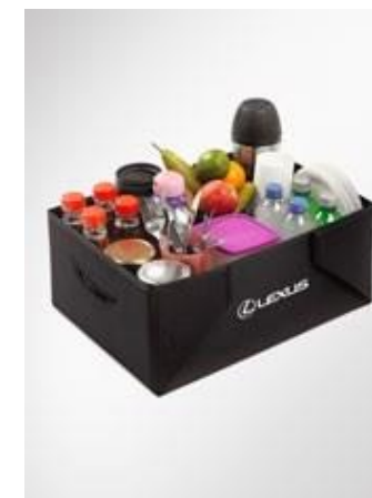
GEANTĂ DE DEPOZITARE

Setul de cablaj original pentru cârligul de remorcare permite conectarea sigură a remorcii la rețeaua de bord a mașinii.