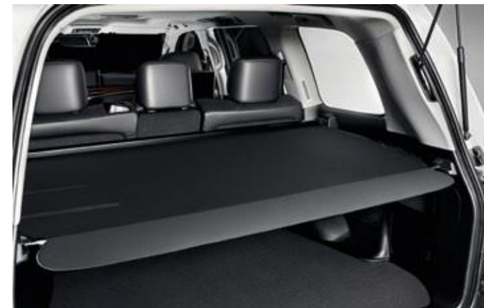
RULOU PENTRU PORTBAGAJ, NEGRU