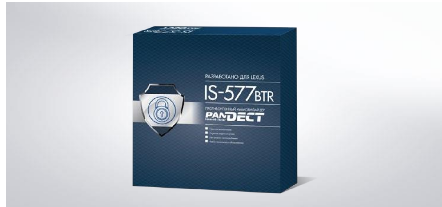
DISPOZITIV DE IMOBILIZARE PandECT IS-577BTR