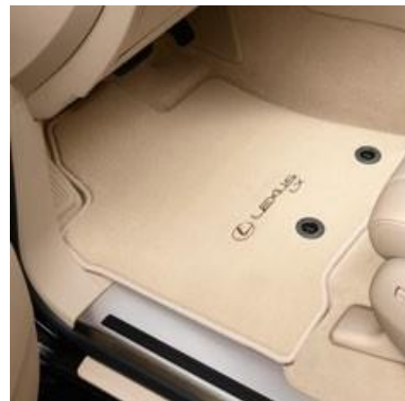
COVORAȘE TEXTILE BEJ

PZ49C-Q2353-DN – 5 locuri PZ49C-Q2354-DN – 7 locuri