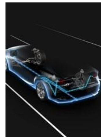
CABLAJ LA CÂRLIGUL DE REMORCARE 7P

Conceput special pentru Lexus LX, cârligul de remorcare oferă o cuplare sigură la remorca tractată.