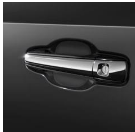
FOLIE DE PROTECȚIE SUB MÂNERELE PORTIERELOR

Deflectorul protejează capota și parbrizul mașinii tale de zgârieturi minore și așchii în timpul deplasării.