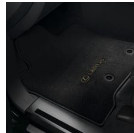
SET DE COVORAȘE DIN MATERIAL TEXTIL PENTRU HABITACLU

Covorașele textile elegante, practice și durabile oferă rafinament interiorului indiferent de vremea de afară și se curăță ușor de murdărie.