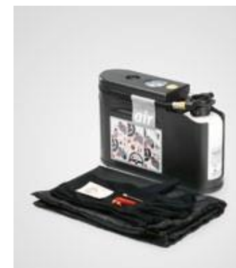
KIT DE REPARARE A ANVELOPELOR

Sistemul detectează scăderea presiunii la una sau mai multe anvelope și avertizează șoferul prin intermediul unui indicator.