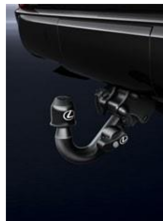
CÂRLIG DE REMORCARE DETAȘABIL

Este indispensabilă atunci când transporti obiecte mici și/sau fragile. Plasa este atașată de cârlige speciale aflate deja în portbagajul mașinii.