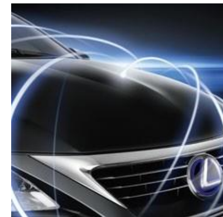
PROTECȚIE CAROSERIE PROTECT

Protejează radiatorul mașinii tale de pietre mici și insecte în timpul exploatării.