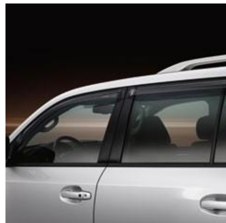
DEFLECTOARE GEAMURI LATERALE