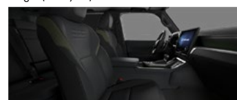
Negru cu accente olive (LC20/21)*