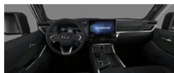
Maro cu accente negre (LC20)*