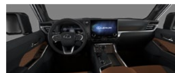
Maro cu accente negre (LA41)*

Listă dotărilor constituie o selecție a celor mai importante opțiuni. Compania „Continental” S.R.L. își rezervă dreptul de a modifica broșura în urma depistării unor erori, modificări de structură sau în urma unor comunicări din partea producătorului, fără nici o informare prealabilă. Garanția automobilelor Lexus este de 3 ani sau 100.000 km parcurși. Consumul de carburant și emisiile de CO 2 ale unui autoturism depind nu doar de randamentul energetic. Aceasta este influențată atât de modul de conducere al autovehiculului, cât și de alți factori care nu sunt de natură tehnică. Dioxidul de carbon (CO 2 ) este principalul gaz cu efect de seră, responsabil pentru încălzirea globală. Broșură valabilă până la lansarea următoarei ediții.