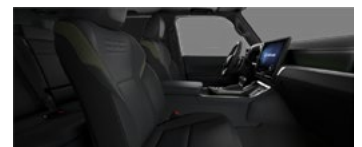
Negru cu accente olive (LC20/21)*