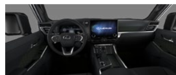
Maro cu accente negre (LC20)*