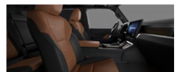
Maro cu accente negre (LA40/41)*