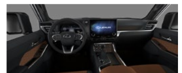
Maro cu accente negre (LA41)*

Listă dotărilor constituie o selecție a celor mai importante opțiuni. Compania „Continental” S.R.L. își rezervă dreptul de a modifica broșura în urma depistării unor erori, modificări de structură sau în urma unor comunicări din partea producătorului, fără nici o informare prealabilă. Garanția automobilelor Lexus este de 3 ani sau 100.000 km parcurși. Consumul de carburant și emisiile de CO 2 ale unui autoturism depind nu doar de randamentul energetic. Aceasta este influențată atât de modul de conducere al autovehiculului, cât și de alți factori care nu sunt de natură tehnică. Dioxidul de carbon (CO 2 ) este principalul gaz cu efect de seră, responsabil pentru încălzirea globală. Broșură valabilă până la lansarea următoarei ediții.