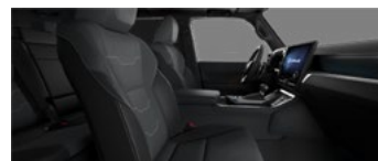
Gri-închis cu accente de negru (LA10/11)*