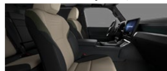
Bej cu accente negre și olive (LC12/13)*