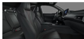
Negru F SPORT