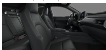
Negru F Sport / Luxury