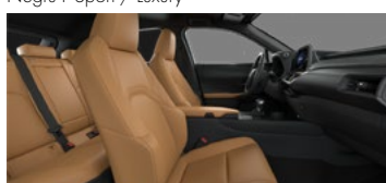
Maro F Sport / Luxury