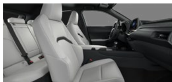
Gri-deschis F Sport / Luxury