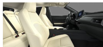
Bej / Luxury