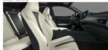
Alb F SPORT