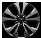
F Sport, F Sport Design