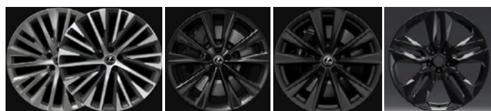
Luxury Executive, Premium F Sport F Sport Plus Special Edition