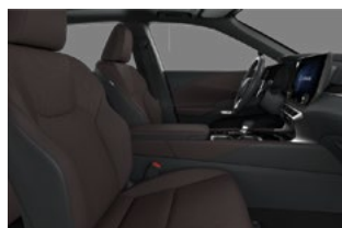
Sepia întunecată (Premium)