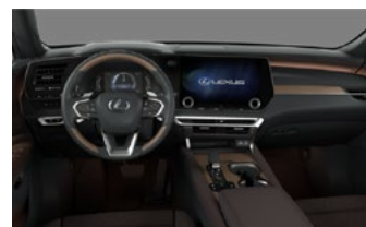
Sepia întunecată (Luxury)