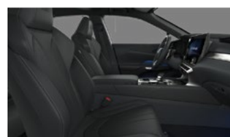
Negru F Sport

Lista dotărilor constituie o selecție a celor mai importante opțiuni. Compania „Continental” S.R.L. își rezervă dreptul de a modifica broșura în urma depistării unor erori, modificări de structură sau în urma unor comunicări din partea producătorului, fără nici o informare prealabilă. Garanția automobilelor Lexus este de 3 ani sau 100.000 km parcurși. Consumul de carburant și emisiile de CO 2 ale unui autoturism depind nu doar de randamentul energetic. Aceasta este influențată atât de modul de conducere al autovehiculului, cât și de alți factori care nu sunt de natură tehnică. Dioxidul de carbon (CO 2 ) este principalul gaz cu efect de seră, responsabil pentru încălzirea globală. Broșură valabilă până la lansarea următoarei ediții.