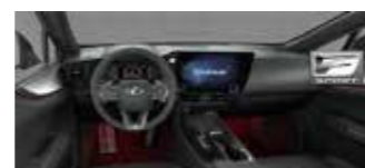
Negru F Sport