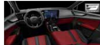
Roșu cu accent negru F Sport