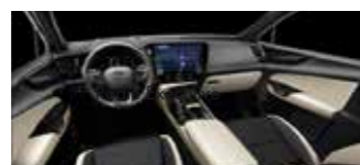
Negru cu accent bej Executive, Executive+