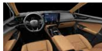
Maro Executive, Executive+