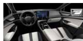
Alb cu accent negru F Sport